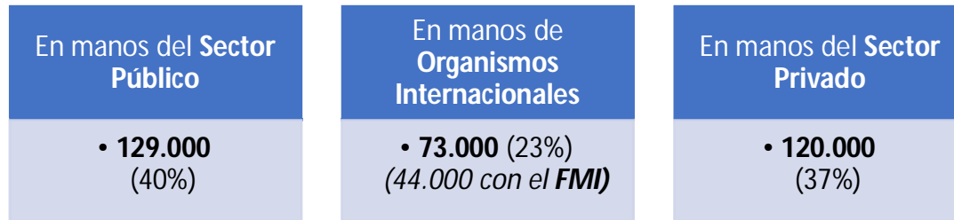
Figura N°2. Deuda Pública Total por acreedor, a diciembre 2019. En millones de U$S.